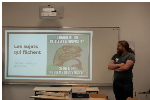
Atelier Bibliothéconomie critique