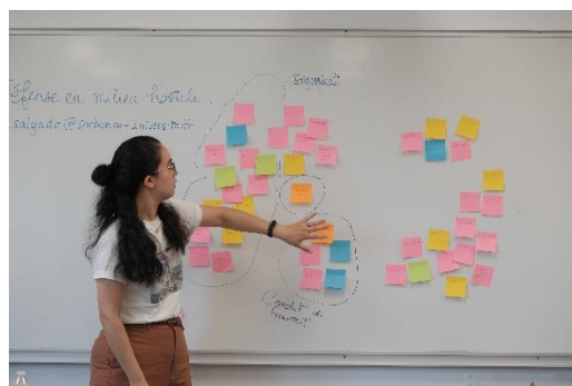
Atelier Risques psycho-sociaux