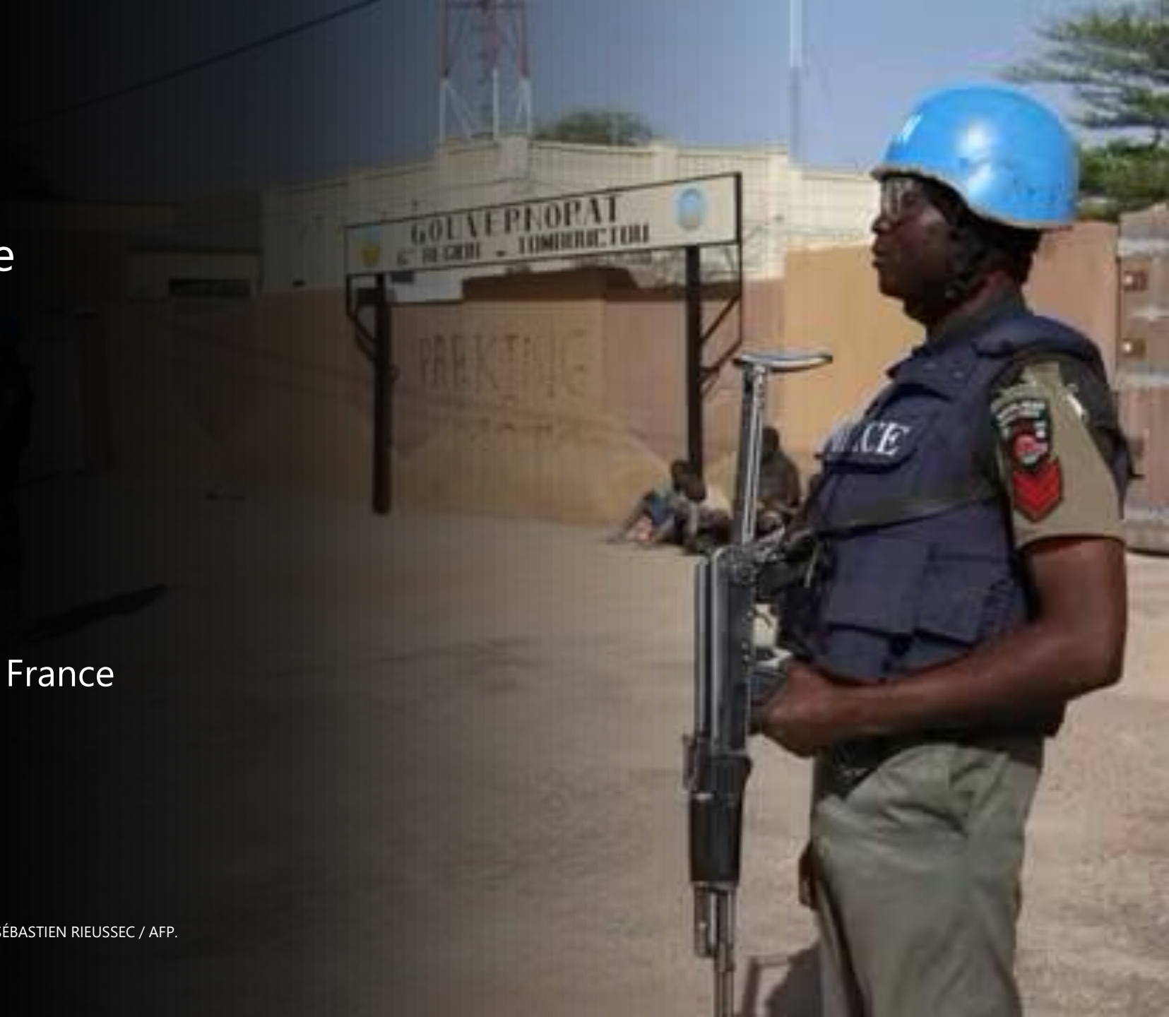
Photo : Casques bleus de l'ONU devant l'aéroport de Tombouctou, le 4 février 2016. SÉBASTIEN RIEUSSEC / AFP.