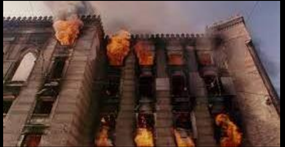
UNESCO : Bibliothèque nationale et universitaire de Sarajevo bombardée le 25 août 1992. Environ 2 millions de documents détruits.