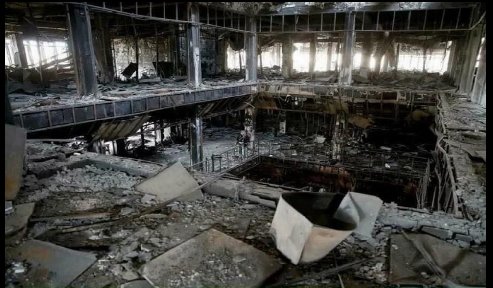
Mosul University (2017) : L'État islamique saccage et incendie en 2015 la bibliothèque universitaire de Mossoul.