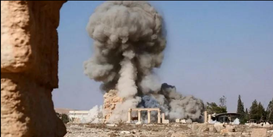
Temple de Baalshamin à Palmyre attaqué en août 2015 par l'État islamique avec des explosifs.