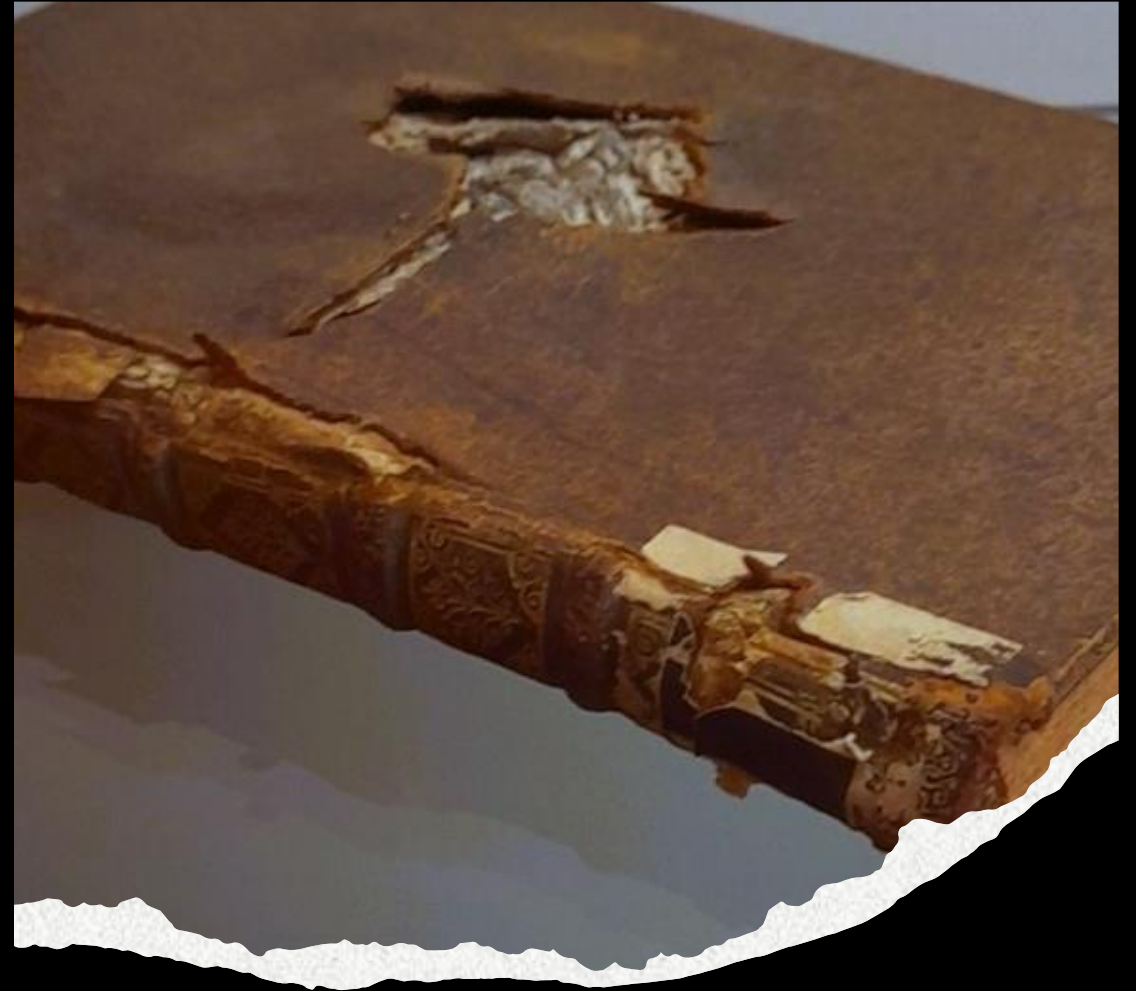
livre traversé par un projectile, Abbaye de Saint-Mihiel.

« Les guerres prenant naissance dans l'esprit des hommes, c'est dans l'esprit des hommes que doivent être élevées les défenses de la paix ». UNESCO