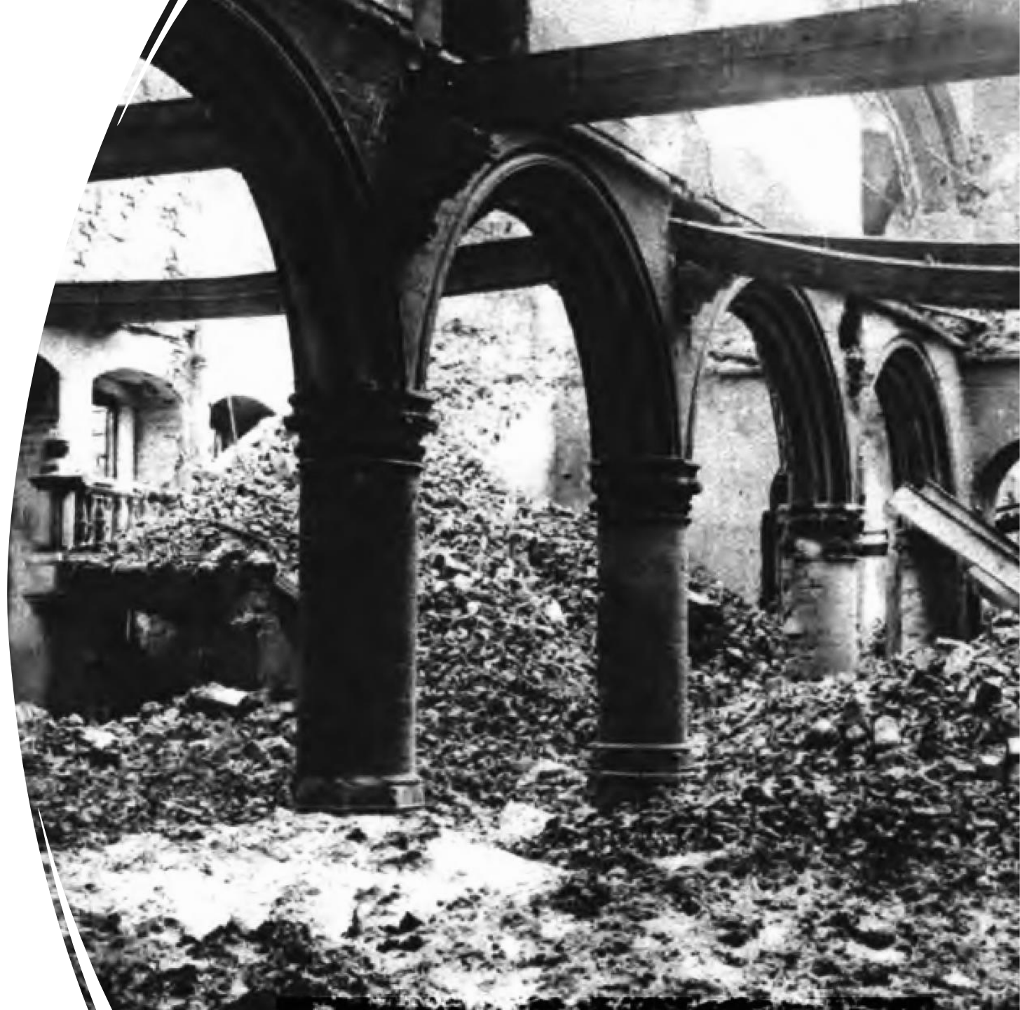
Photo : bibliothèque de Louvain, The New York Times Current History of the European War, Volume II, 1915.