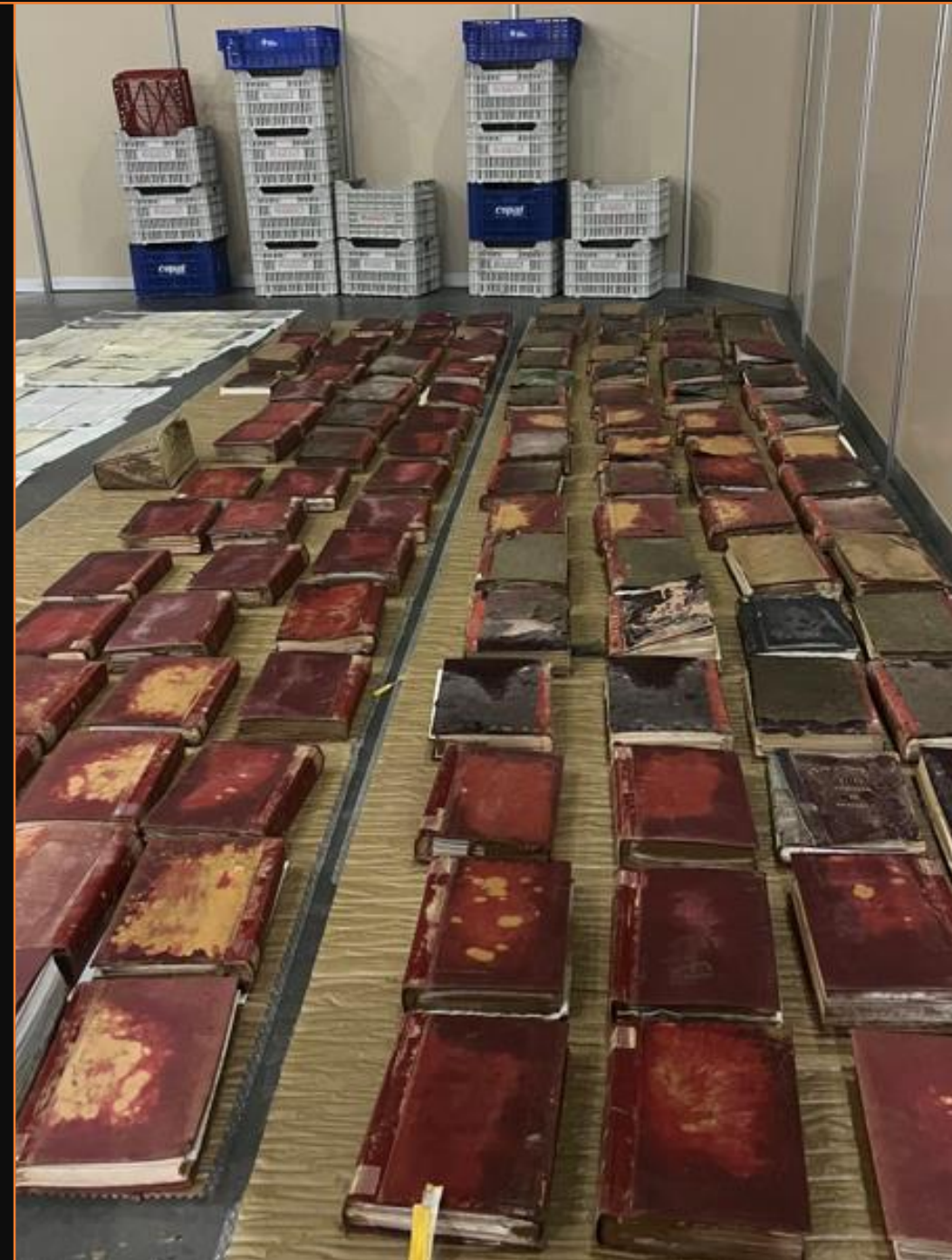
"Cultura habilita más de 6.000 metros cuadrados en Feria Valencia para la recuperación, secado y limpieza de documentos de archivos afectados por la riada". 22.11.2024.

Dangerosité du quotidien = Plan de sauvegarde des biens culturels